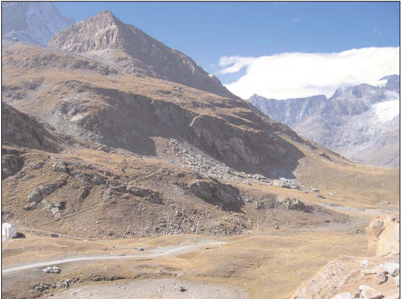
Am Fuss der Schwarzen Tschuggen finden sich die ältesten Spuren in der Geschichte Zermatts.

3. Man könnte auch an eine Hirtenunterkunft denken. Die günstigen Weideplätze oberhalb der Waldgrenze